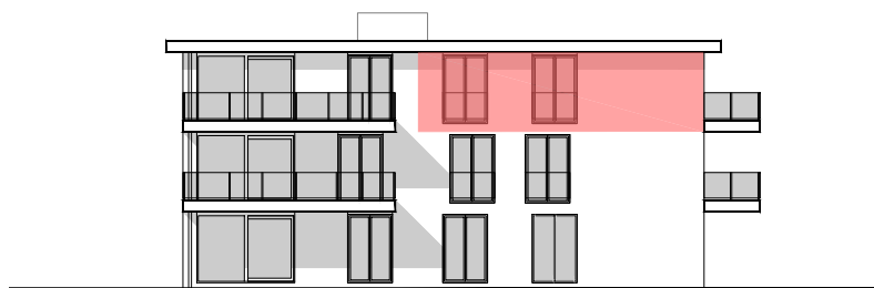
BLOK B NOORDWEST GEVEL

Dit plan is indicatief, alle maten zijn richtinggevend. Meubilair en toebehoren zijn illustratief en maken geen deel uit van de verkoopsovereenkomst.