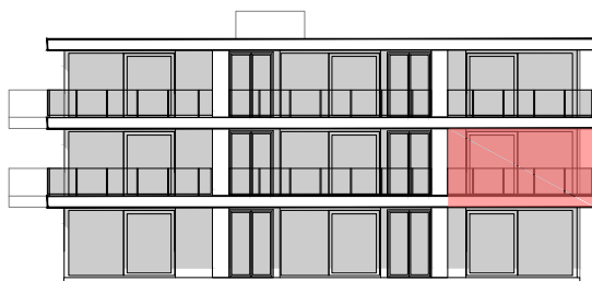
BLOK B ZUIDOOST GEVEL

Dit plan is indicatief, alle maten zijn richtinggevend. Meubilair en toebehoren zijn illustratief en maken geen deel uit van de verkoopsovereenkomst.