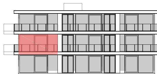
BLOK B ZUIDOOST GEVEL